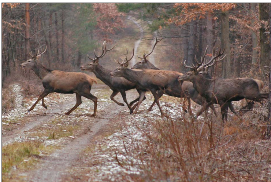
A legfontosabbnak ítélt témakörök: a vadgazdálkodás...